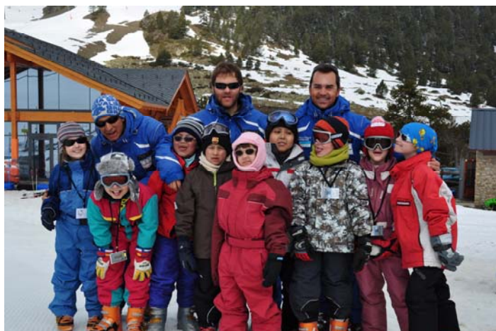
Sortida a Andorra