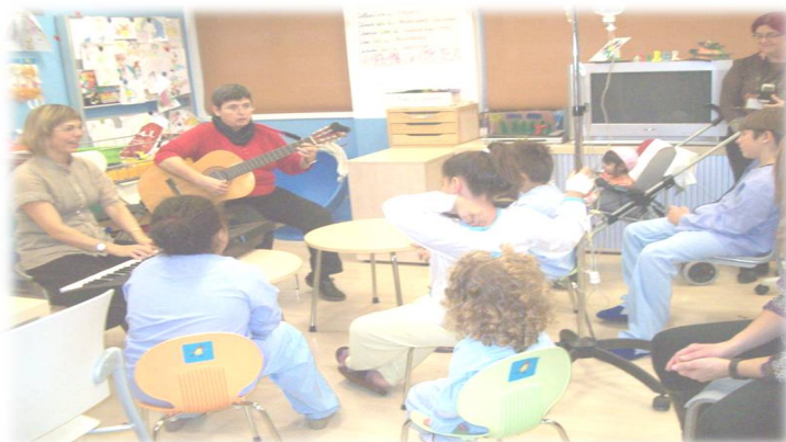
Taller de Musicoteràpia

Durant l'any 2010 ha seguit desenvolupant-se en l'àrea de pediatria de l'hospital Germans Trias i Pujol i, des del mes de setembre, s'ha iniciat també en l'àrea de pediatria de l'Hospital de Sant Pau de Barcelona