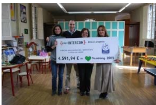
Lliurament Taló Grup Intercom

L'any 2009 la nostra Fundació va ser elegida pel GRUP INTERCOM com a destinatària del projecte Teaming. El 18 de març va venir lloc l'entrega del taló.