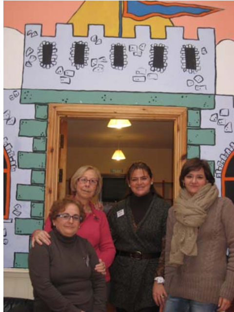
Visita a Barrestown

Quatre persones representants de la Fundació, acompanyats per oncòlegs pediàtres i altres representants dels diferents hospitals van estar convidats a visitar les instal·lacions de Barrestown a Irlanda.