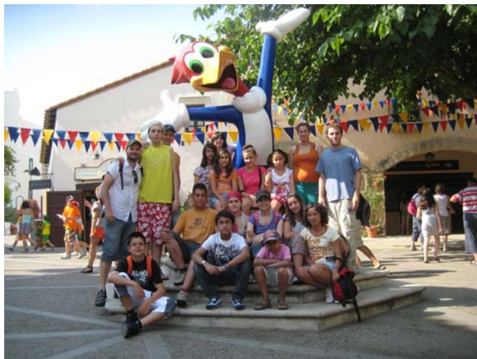
Sortida a Port Aventura

Del 2 al 4 de juliol un grup de joves acompanyats de monitors van passar 2 magnífics dies amb les seves corresponents nits a les instal·lacions de Port Aventura.