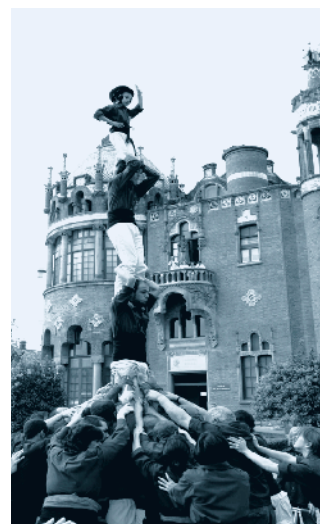
Castellers Vila de Gràcia