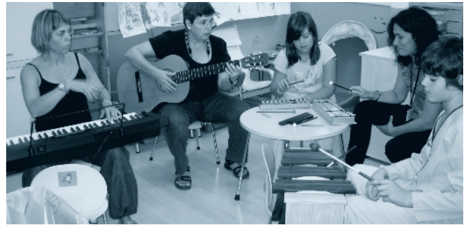
Musicoteràpia / Musicoterapia

Durant el 2009 hem comptat amb la col·laboració de 194 voluntaris: