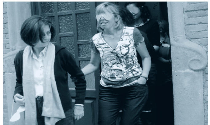
Curs de formació continua / Curso de formación continua