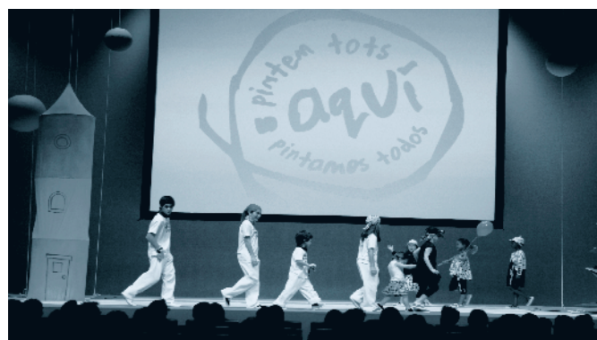
VII Desfilada infantil / VII Desfile infantil